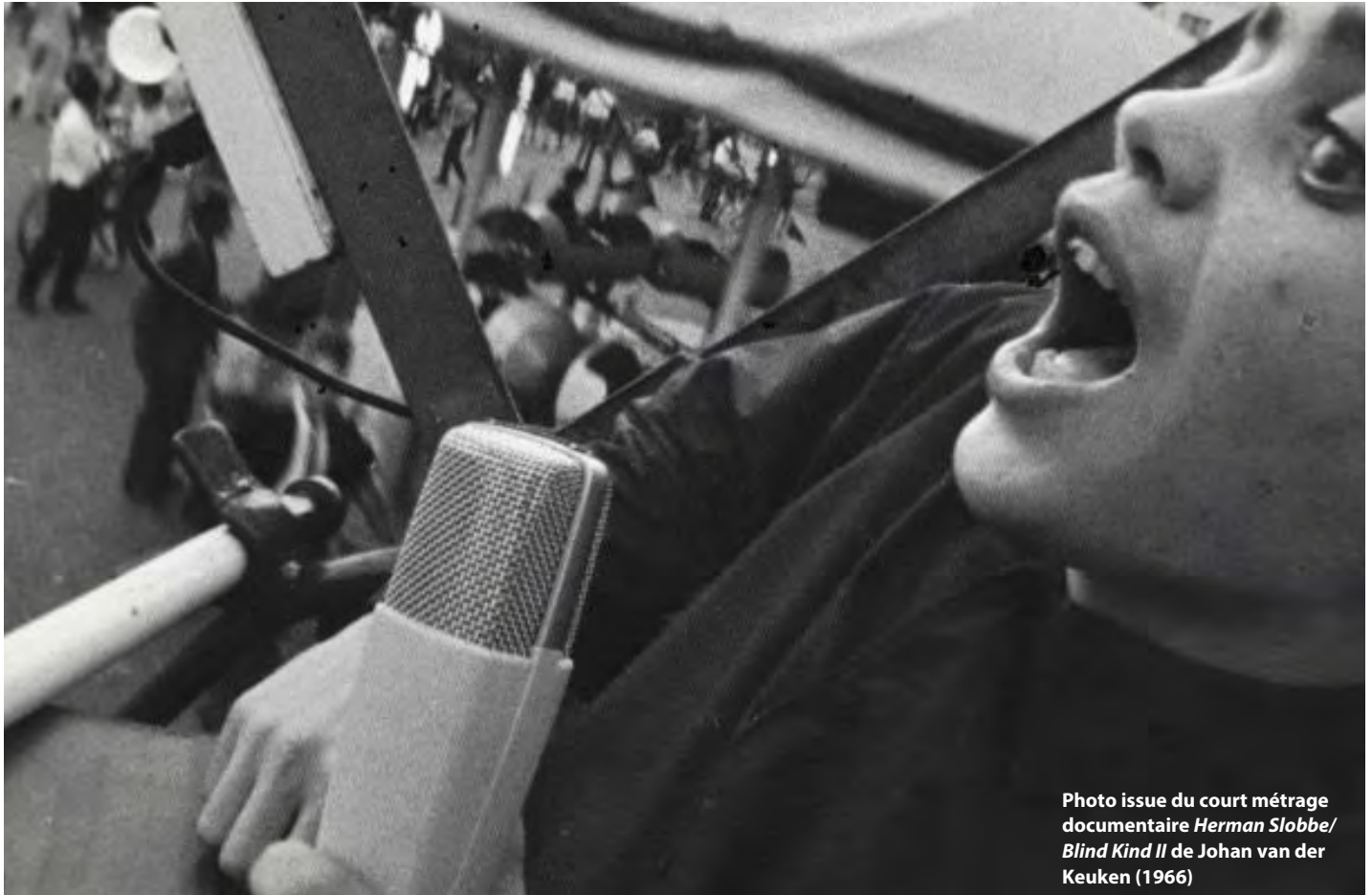
Photo issue du court métrage documentaire Herman Slobbe/Blind Kind II de Johan van der Keuken (1966)