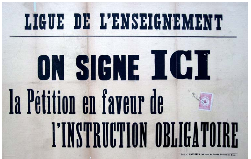
Affiche, Février 1906.